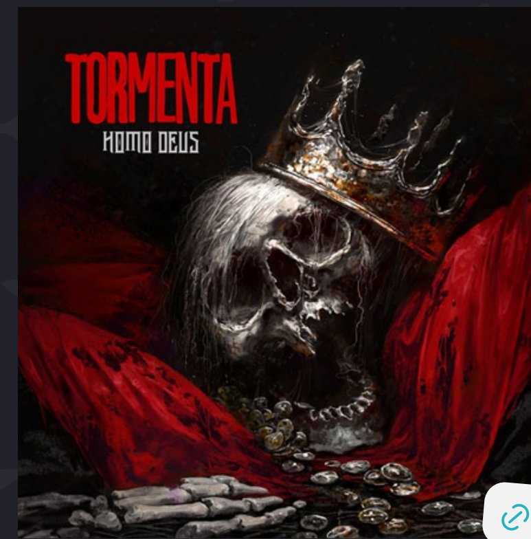
Homo Deus (EP 2023)