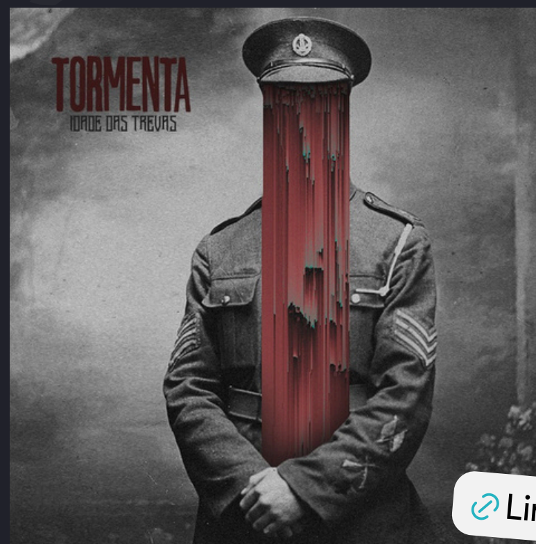
Idade das Trevas (single 2022)