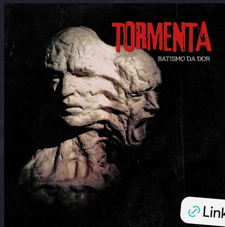
Batismo da Dor (2019)