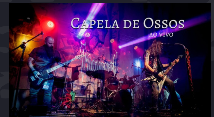
Shows ao vivo