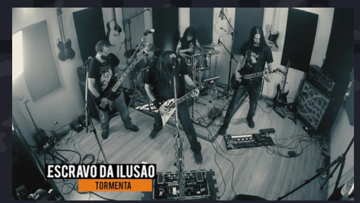
Ao vivo em estúdio